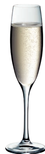
SEKTKELCH 07 FLUTE CHAMPAGNE 07

Inhalt / Capacity 210 ml Höhe / Height 205 mm Ø 68 mm VPE / PU 6 Stk./pcs. Art-Nr. / No: 58.0020.0029 58.0020.0129 (0,1 l)