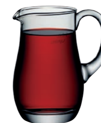
KRUG 58 * JUG 58 *

Inhalt / Capacity 1000 ml Höhe / Height 174 mm Ø 165 mm VPE / PU 1 Stk./pc. Art-Nr. / No: 58.0092.0960 (1,0 l)