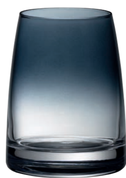
WASSERGLAS 15 RAUCHGRAU TUMBLER 15 SMOKY GREY

Inhalt / Capacity 325 ml Höhe / Height 102 mm Ø 80 mm VPE / PU 6 Stk./pc. Art-Nr. / No: 58.0051.0015