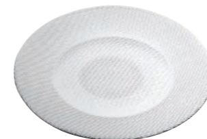
PLATZTELLER * SETTING PLATE *

Höhe / Height 20 mm Ø 31 cm VPE / PU 1 Stk./pc. Art-Nr. / No: 58.0095.0001