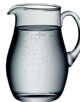
KRUG 60 * JUG 60 *

Edelstahl 18/10 / stainless 18/10 2cl + 4cl Höhe / Height 73 mm VPE / PU 1 Stk./pc. Art-Nr. / No: 58.4127.1002