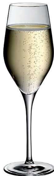
CHAMPAGNER 29 CHAMPAGNE 29

Inhalt / Capacity 265 ml Höhe / Height 223 mm Ø 70 mm VPE / PU 6 Stk./pcs. Art-Nr. / No. 58.0050.0029 58.0050.0129 (0,1 l)