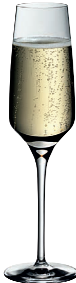
SEKTKELCH 07 FLUTE CHAMPAGNE 07

Inhalt / Capacity 265 ml Höhe / Height 223 mm Ø 70 mm VPE / PU 6 Stk./pcs. Art-Nr. / No. 58.0050.0029 58.0050.0129 (0,1 l)