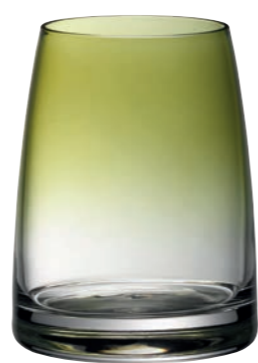
WASSERGLAS 15 OLIV TUMBLER 15 OLIVE

Inhalt / Capacity 325 ml Höhe / Height 102 mm Ø 80 mm VPE / PU 6 Stk./pc. Art-Nr. / No: 58.0053.0015