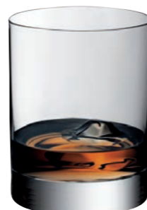
TUMBLER XL 16

Inhalt / Capacity 420 ml Höhe / Height 106 mm Ø 85 mm VPE / PU 6 Stk./pcs. Art-Nr. / No: 58.0030.0016