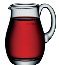
KRUG 55 * JUG 55 *

Inhalt / Capacity 250 ml Höhe / Height 117 mm Ø 106 mm VPE / PU 6 Stk./pcs. Art-Nr. / No: 58.0092.0357 (0,25 l)