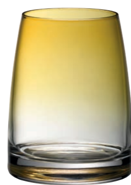
WASSERGLAS 15 BERNSTEIN TUMBLER 15 AMBER

Inhalt / Capacity 325 ml Höhe / Height 102 mm Ø 80 mm VPE / PU 6 Stk./pc. Art-Nr. / No: 58.0052.0015