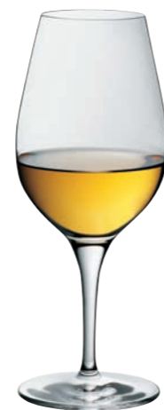
TASTING / DESSERTWEIN 04 TASTING 04

Inhalt / Capacity 387 ml Höhe / Height 210 mm Ø 79 mm VPE / PU 6 Stk./pcs. Art-Nr. / No: 58.0020.0002 58.0020.0102 (0,1 l) 58.0020.0202 (0,2 l) 58.0020.0802 (0,1 l + 0,2 l)