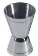
COCKTAILDOPPELMASS * DOUBLE JIGGER *

Edelstahl 18/10 / stainless 18/10 2cl + 4cl Höhe / Height 73 mm VPE / PU 1 Stk./pc. Art-Nr. / No: 58.4127.1002