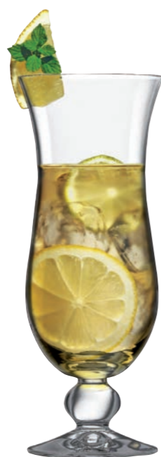
COCKTAIL 96 (Serie MANHATTAN)

Inhalt / Capacity 240 ml Höhe / Height 172 mm Ø 116 mm VPE / PU 6 Stk./pcs. Art-Nr. / No: 58.0010.0025