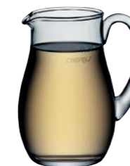
KRUG 57 * JUG 57 *

Inhalt / Capacity 500 ml Höhe / Height 127 mm Ø 137 mm VPE / PU 6 Stk./pcs. Art-Nr. / No: 58.0092.0758 (0,5 l)