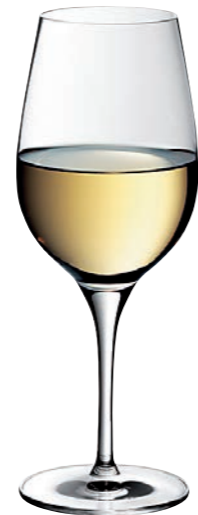
WEISSWEINKELCH 02 WHITE WINE GOBLET 02

Inhalt / Capacity 500 ml Höhe / Height 219 mm Ø 87 mm VPE / PU 6 Stk./pcs. Art-Nr. / No: 58.0020.0001 58.0020.0201 (0,2 l)