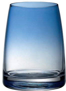
WASSERGLAS 15 RAUCHBLAU TUMBLER 15 SMOKY BLUE

Die Gläser haben eine elegante Form, die sich mit jeder Glasserie kombinieren lässt. Their elegant shape can be combined with any glass series.