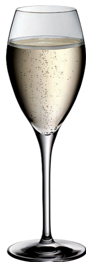
CHAMPAGNER 29 CHAMPAGNE 29

Inhalt / Capacity 387 ml Höhe / Height 175 mm Ø 79 mm VPE / PU 6 Stk./pcs. Art-Nr. / No: 58.0020.0010 58.0020.0210 (0,2 l)