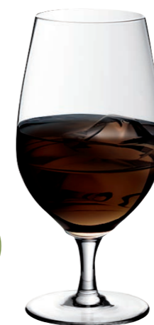
MINIBAR 10 (Serie SMART)

Inhalt / Capacity 387 ml Höhe / Height 175 mm Ø 79 mm VPE / PU 6 Stk./pcs. Art-Nr. / No: 58.0020.0010 58.0020.0210 (0,2 l)