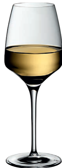
WEISSWEINKELCH 02 WHITE WINE GOBLET 02

Inhalt / Capacity 450 ml Höhe / Height 225 mm Ø 84 mm VPE / PU 6 Stk./pcs. Art-Nr. / No. 58.0050.0001 58.0050.0201 (0,2 l)