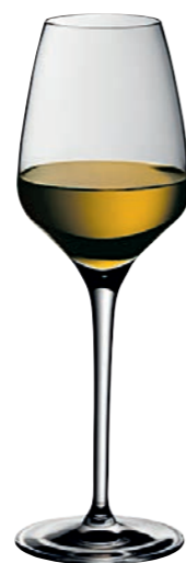
SHERRY / PORTWEIN 04 SHERRY / PORT 04

Inhalt / Capacity 188 ml Höhe / Height 224 mm Ø 63 mm VPE / PU 6 Stk./pcs. Art-Nr. / No. 58.0050.0007 58.0050.0107 (0,1 l)