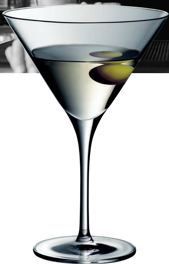
MARTINI 25 (Serie ROYAL)

Inhalt / Capacity 60 ml Höhe / Height 100 mm Ø 46 mm VPE / PU 6 Stk./pcs. Art-Nr. / No: 58.0030.0021 58.0030.0821 (2 cl + 4 cl)