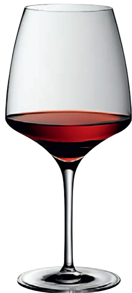
BURGUNDER 99 BURGUNDY 99

Inhalt / Capacity 695 ml Höhe / Height 231 mm Ø 107 mm VPE / PU 6 Stk./pcs. Art-Nr. / No. 58.0050.0099 58.0050.0299 (0,2 l)