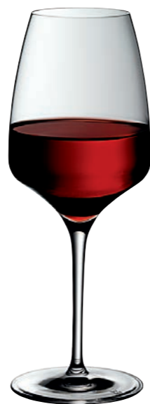
ROTWEINKELCH 01 RED WINE GOBLET 01

Inhalt / Capacity 645 ml Höhe / Height 238 mm Ø 95 mm VPE / PU 6 Stk./pcs. Art-Nr. / No. 58.0050.0035 58.0050.0235 (0,2 l)