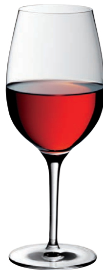
ROTWEINKELCH 01 RED WINE GOBLET 01

Inhalt / Capacity 650 ml Höhe / Height 227 mm Ø 95 mm VPE / PU 6 Stk./pcs. Art-Nr. / No: 58.0020.0035 58.0020.0235 (0,2 l)