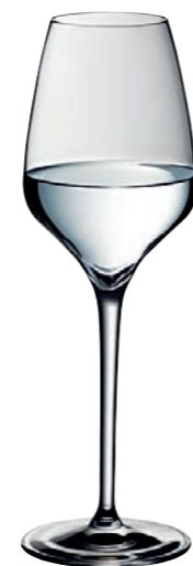
DIGESTIF 04 DIGESTIVE 04

Inhalt / Capacity 190 ml Höhe / Height 200 mm Ø 66 mm VPE / PU 6 Stk./pcs. Art-Nr. / No. 58.0050.0004