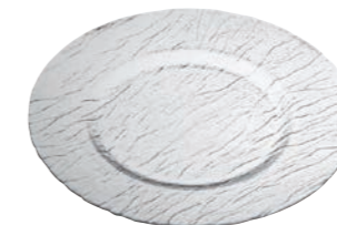
PLATZTELLER * SETTING PLATE *

Höhe / Height 20 mm Ø 31 cm VPE / PU 1 Stk./pc. Art-Nr. / No: 58.0095.0001