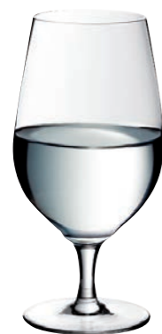
WASSERGLAS 10 MINERAL WATER 10

Inhalt / Capacity 290 ml Höhe / Height 185 mm Ø 73 mm VPE / PU 6 Stk./pcs. Art-Nr. / No: 58.0020.0004