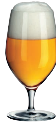
BIERGLAS 11 BEER GLASS 11

Inhalt / Capacity 104 ml Höhe / Height 169 mm Ø 56 mm VPE / PU 6 Stk./pcs. Art-Nr. / No: 58.0010.0023