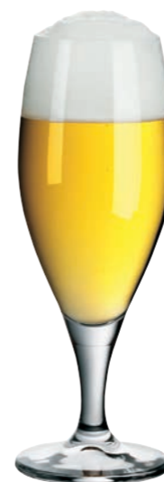
BIERTULPE 11 TULIP BEER GLASS 11

Inhalt / Capacity 340 ml Höhe / Height 172 mm Ø 111 mm VPE / PU 6 Stk./pcs. Art-Nr. / No: 58.0030.0097