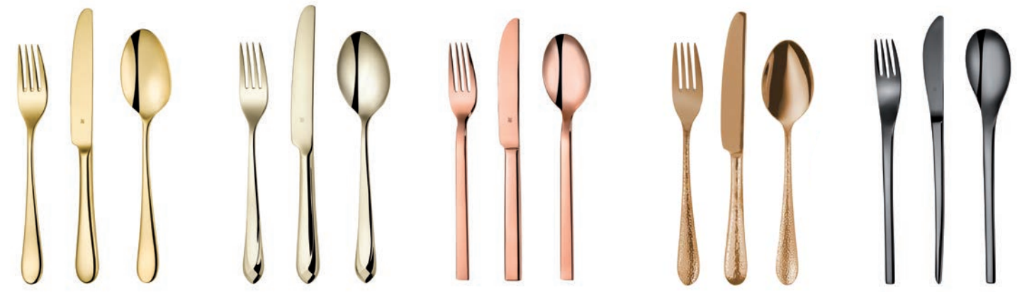
PVD Gold PVD Gold