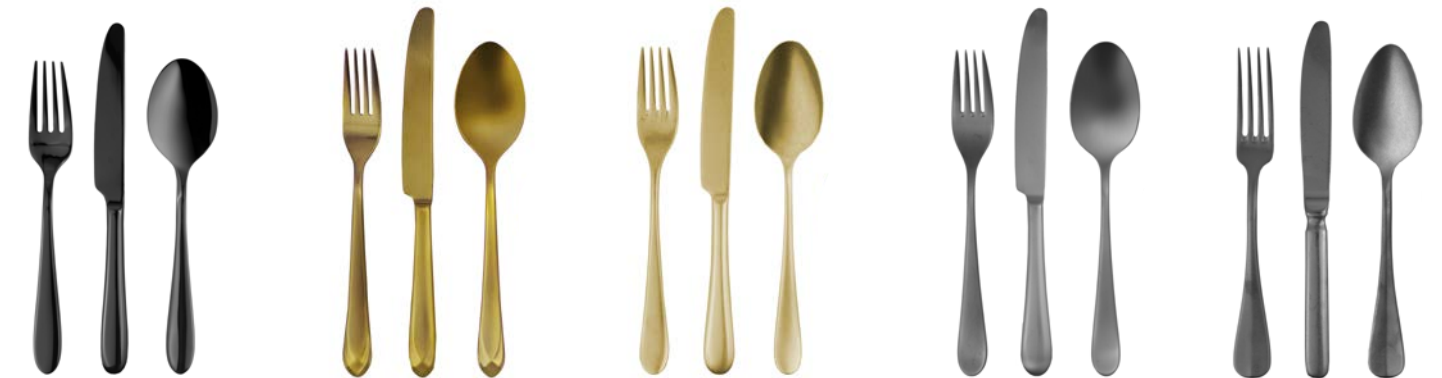
PVD Schwarz PVD black